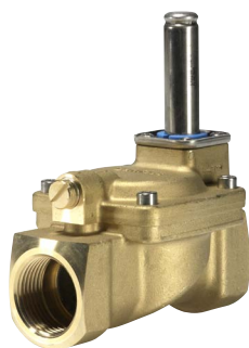
Tabela 2. Cewka elektromagnetyczna typu BE

(*) - wartość przepływu dla wody przy ciśnieniu różnicowym 1 bar